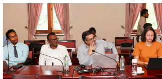
Final project management meeting novembro 2024 Sri Lanka

A metodologia aplicada consistiu no desenvolvimento colaborativo de um currículo de formação adequado às necessidades de formação identificadas preliminarmente, na conceção colaborativa e entrega de formação para o primeiro grupo de formandos que atuaram como formadores e multiplicadores dentro da sua instituição e na multiplicação de formações nas universidades-alvo do Sri Lanka.