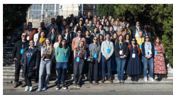
Sessão de boas vindas, atividade de quebra gelo e foto de todos os participantes do evento