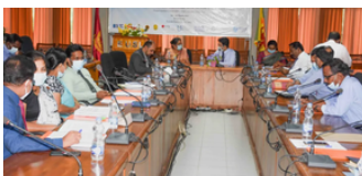
Kick off meeting março 2021 Sri Lanka

O projeto ENACT foi um desses projetos, sendo que o foco do mesmo passava pela melhoria da gestão e da qualidade do ensino universitário no Sri Lanka, capacitando o pessoal não académico para desenvolver o desempenho organizacional e apoiar os esforços de modernização e reformas atuais e futuras no ensino superior. Este projeto decorreu entre 2021 e final de 2024, tendo sido financiado com o apoio da Comissão Europeia e co-financiado pelo Programa Erasmus+ da União Europeia.