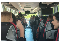
Equipa DRH de apoio ao evento, Pata-paper e Deslocação dos participantes em autocarro